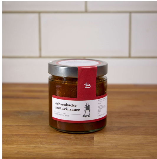
511-609 OCHSENBACKE IN PORTWEINSAUCE 6x 320ML