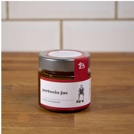
522-131 PORTWEIN JUS 6x 100ML

hengefertig in hamburg! ein schneller genuss – ohne viel aufwand lässt sich ein gutes gericht zaubern.