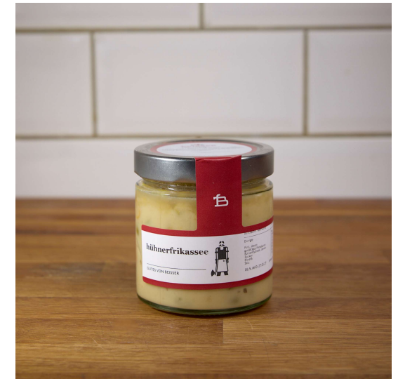
511-606 HÜHNERFRIKASSEE 6x 100ML